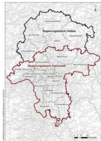
Abbildung 1: Räumlicher Bezug des Leitbildes

Der Bezugsraum des Leitbildes hat eine Fläche von insgesamt 12.826 km 2 und 4.962.460 Einwohner (HSL 2017), davon entfallen auf den Reg.-Bez. Darmstadt: 7.445 km 2 ; 3.922.369 Einwohner und den Reg.-Bez. Gießen: 5.381 km 2 ; 1.040.091 Einwohner.