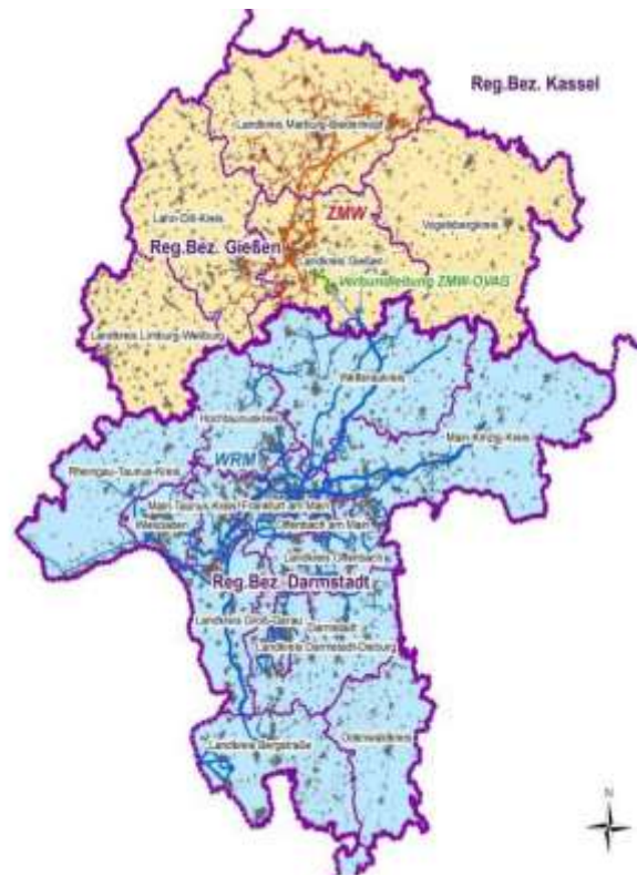
Abbildung 2: Regionale Verbundstruktur der öffentlichen Wasserversorgung (Grundlagen: Arbeitsgemeinschaft Wasserversorgung Rhein-Main (WRM), und Zweckverband Mittelhessische Wasserwerke (ZMW))